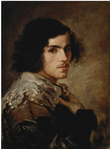
Retrato de un joven