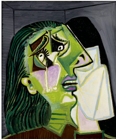
Mujer que llora