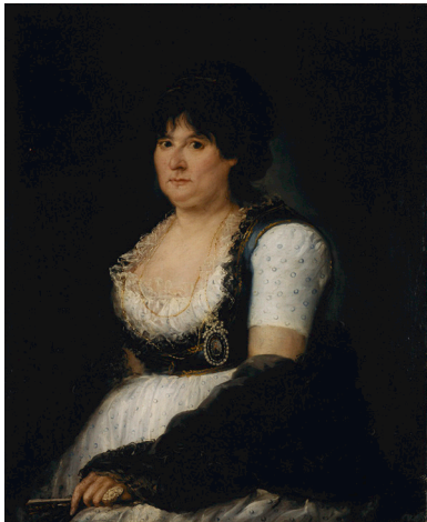
Retrato de una dama