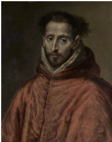
Retrato de un cardenal

Algo que te parezca especialmente interesante de esta obra